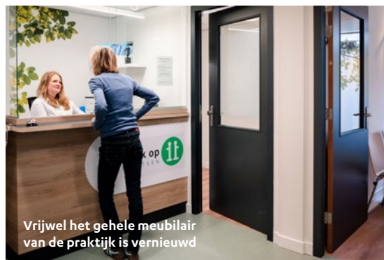
Vrijwel het gehele meubilair van de praktijk is vernieuwd