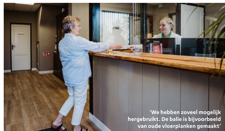
'We hebben zoveel mogelijk hergebruikt. De balie is bijvoorbeeld van oude vloerplanken gemaakt'