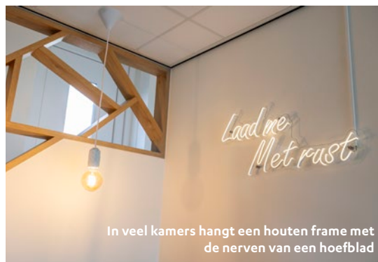
In veel kamers hangt een houten frame met de nerven van een hoefblad