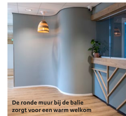
De ronde muur bij de balie zorgt voor een warm welkom

Het hoefblad, dat veel groeit in de omgeving, komt terug in het logo van de praktijk