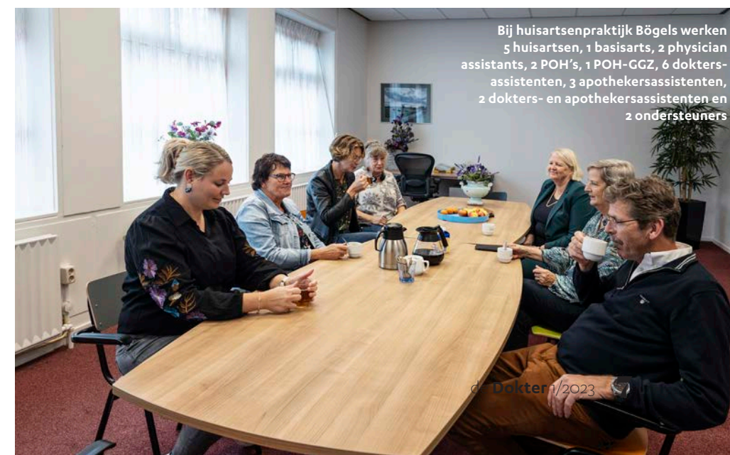
Bij huisartsenpraktijk Bögels werken 5 huisartsen, 1 basisarts, 2 physician assistants, 2 POH's, 1 POH-GGZ, 6 dokters-assistenten, 3 apothekersassistenten, 2 dokters- en apothekersassistenten en 2 ondersteuners