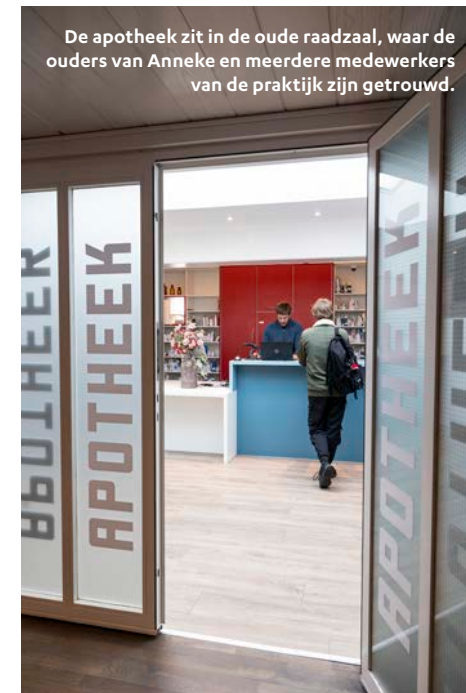
De apotheek zit in de oude raadzaal, waar de ouders van Anneke en meerdere medewerkers van de praktijk zijn getrouwd.