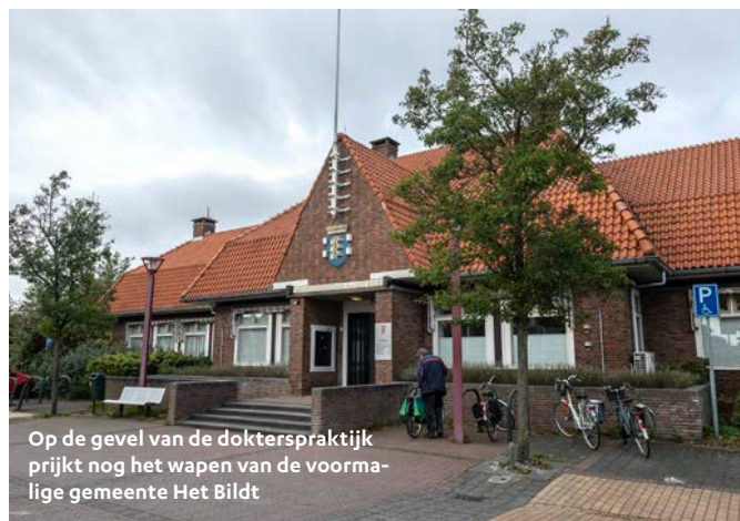
Op de gevel van de dokterspraktijk prijkt nog het wapen van de voormalige gemeente Het Bildt