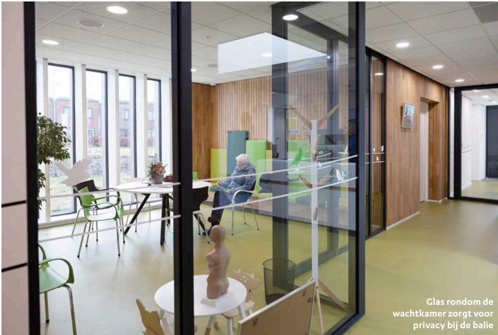
Glas rondom de wachtkamer zorgt voor privacy bij de balie