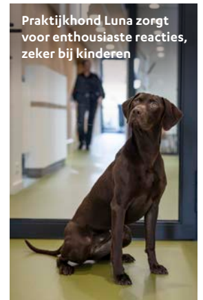
Praktijkhond Luna zorgt voor enthousiaste reacties, zeker bij kinderen