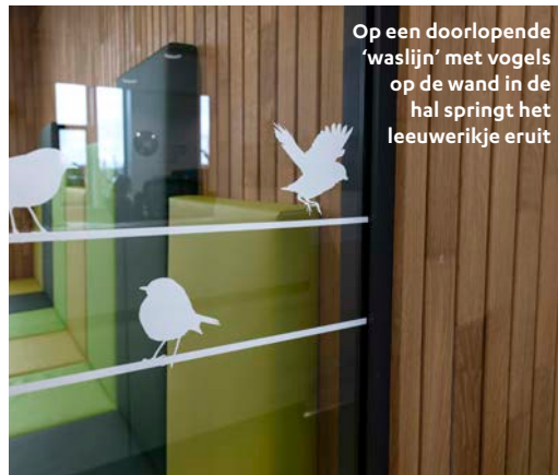
Op een doorlopende 'waslijn' met vogels op de wand in de hal springt het leeuwerikje eruit