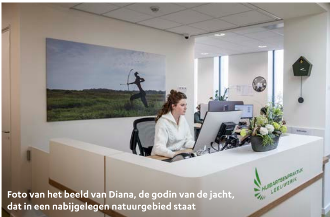
Foto van het beeld van Diana, de godin van de jacht, dat in een nabijgelegen natuurgebied staat