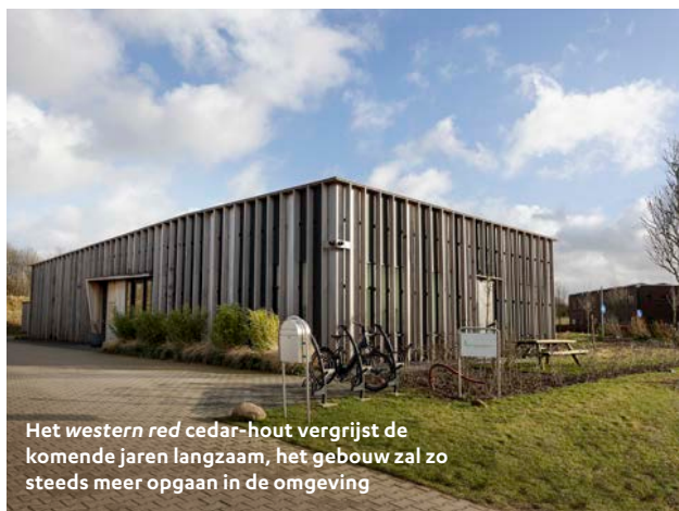
Het western red cedar-hout vergrijsd de komende jaren langzaam, het gebouw zal zo steeds meer opgaan in de omgeving

'Het mooiste schilderij is het uitzicht uit mijn spreekkamer'