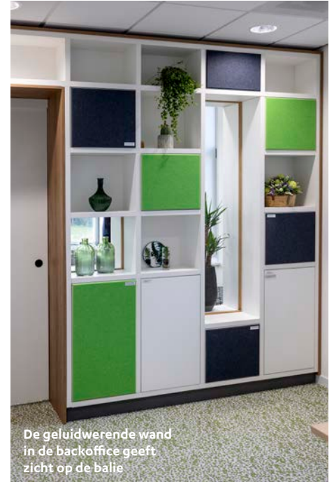
De geluidwerende wand in de backoffice geeft zicht op de balie