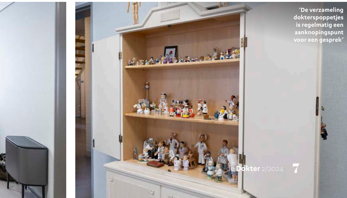
'De verzameling dokterspoppetjes is regelmatig een aanknopingspunt voor een gesprek'