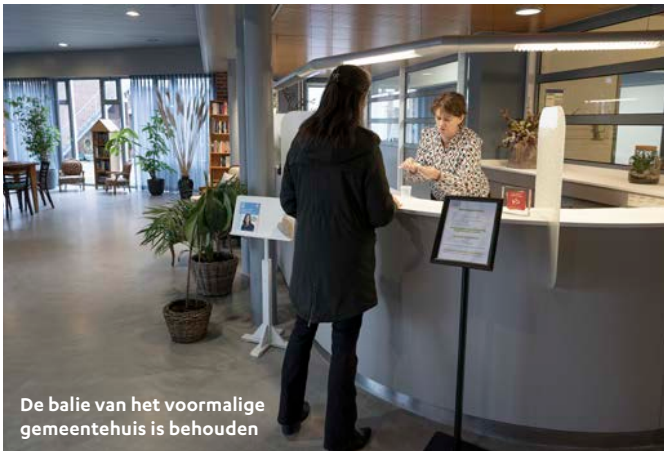
De balie van het voormalige gemeentehuis is behouden