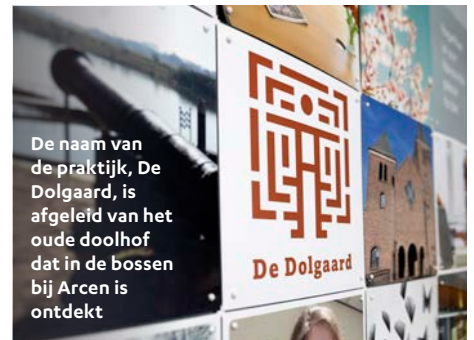
De naam van de praktijk, De Dolgaard, is afgeleid van het oude doolhof dat in de bossen bij Arcen is ontdekt