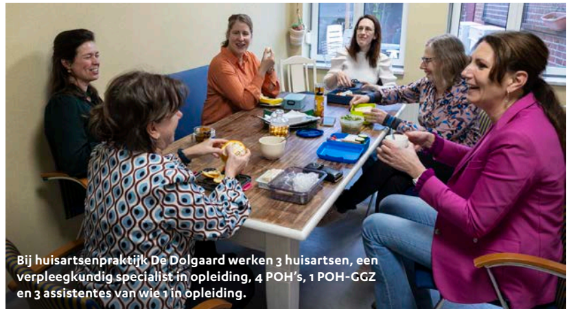
Bij huisartsenpraktijk De Dolgaard werken 3 huisartsen, een verpleegkundig specialist in opleiding, 4 POH's, 1 POH-GGZ en 3 assistentes van wie 1 in opleiding.